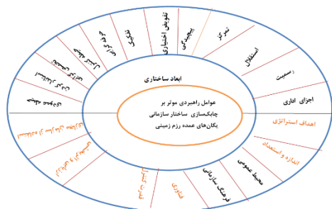
شکل شماره (۱) مدل مفهومی تحقیق

از مجموع مطالعات صورت گرفته عوامل راهبردی مؤثر بر چابک‌سازی ساختار سازمانی یگان‌های عمده رزم زمینی ارتش جمهوری اسلامی ایران که بیشترین فراوانی را در چابکی ساختار سازمانی داشته در قالب مدل مفهومی زیر ارائه می‌شود: